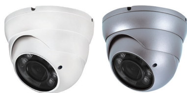
白色 / 銀色